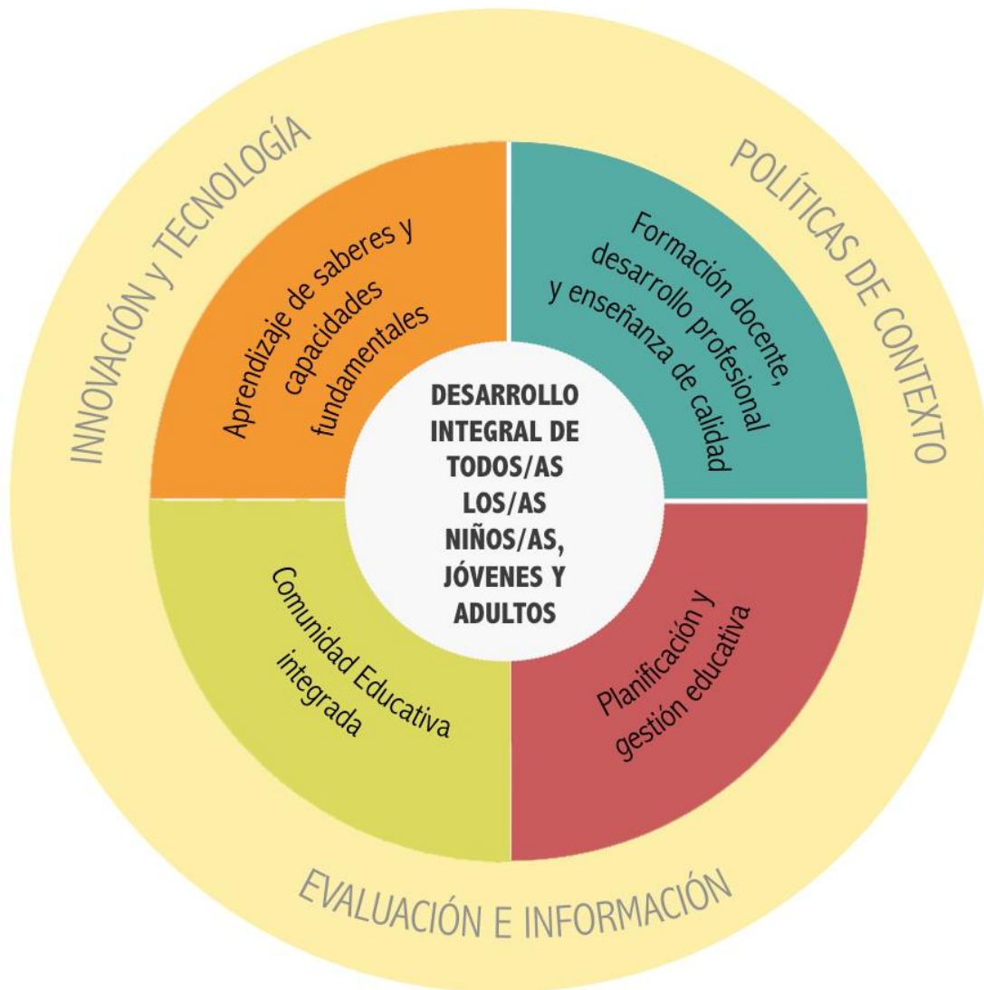
Gráfico 1. Ejes del Plan Nación de Acción 2016-2021 “Argentina Enseña y Aprende”